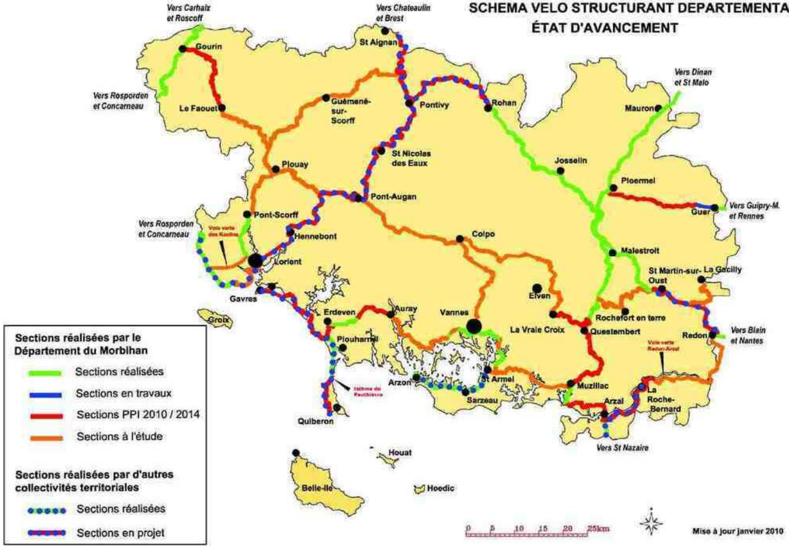
Carte 2 : Etat d'avancement du réseau structurant du Plan vélo départemental à décembre 2009